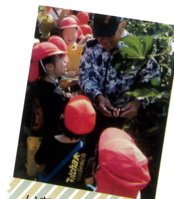
いちじく畑見学 3年生

10月17日(火)1・2年生がさつま芋掘りをおこないました。たくさん掘ろうと一生懸命な児童や、大きなさつま芋がとれたと言って喜びの児童があり、楽しく収穫体験をしてもらうことができました。