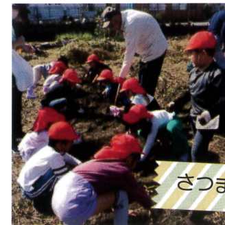
さつま芋掘り 1・2年生